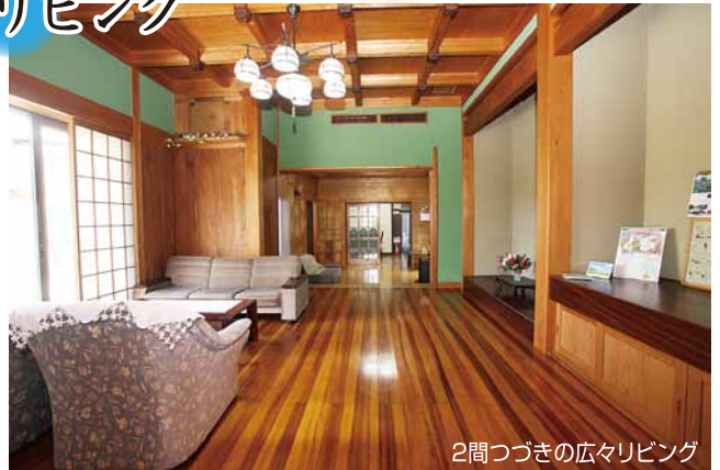
2間つぎの広々リビング