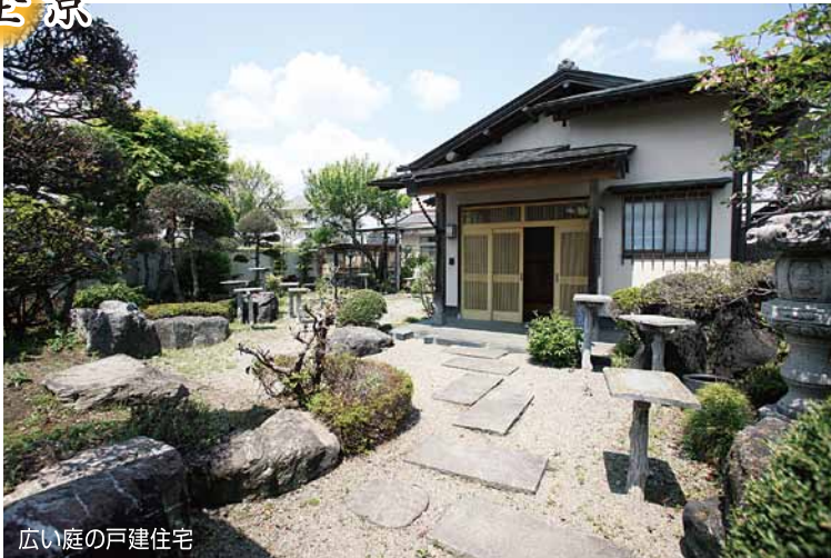
広い庭の戸建住宅