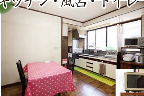
食器類も全て揃っています